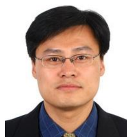
张赤东教授 中国科学技术发展战略研究院